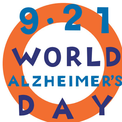
世界アルツハイマーデーのロゴマーク

年齢とともに認知症を発症しやすくなります。認知症を知ること・理解することは認知症を有していても住み慣れた地域で生活をしていくために重要となってきます。今年のアルツハイマー月間は終わってしまいましたが、来年オレンジ色のライトアップを目にしたときには認知症について皆さんで考えてみてはいかがでしょうか。