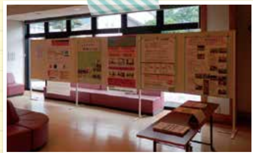
会場前のポスター展示の様子