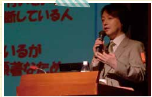
宮地副院長の講演の様子